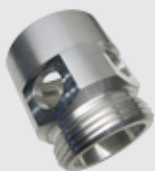
Смотровое стекло с R2" или W2"-7