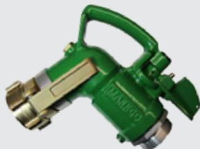
Соединение для носика