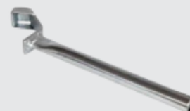
Инструмент для соединений