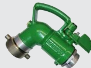
Соединение с внутренней резьбой