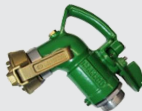
Соединение TANK WAGON