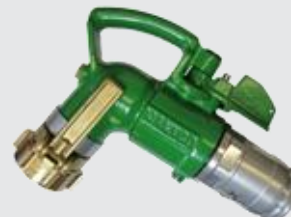
Соединение для носика SNAP и соединением TANK UNIT