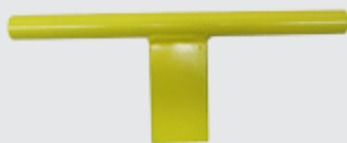
Инструмент для крепления носика