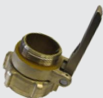
Соединение для носика SNAP