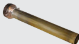
Носик раздаточного крана