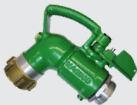
Соединение внутренней резьбой